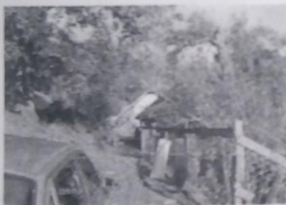
Слика 5: Поглед на породично домаћинство

Прилог: Фотографија породичног домаћинства Х.Б. (5) и личног аутомобила Х.Б. (6)