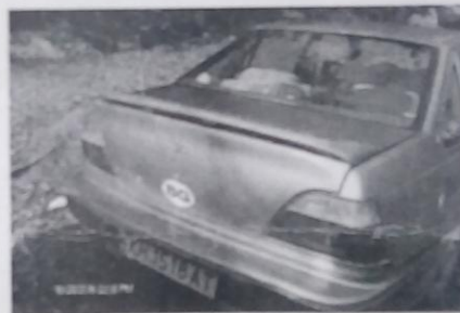
Слика 6: Лични аутомобил, по сазнању