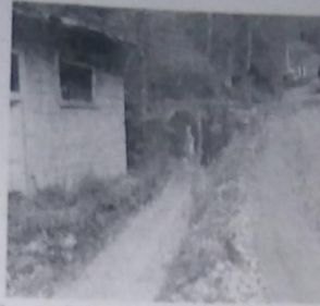
Слика 2: Јамске воде, одвођење