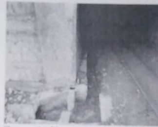
Слика 4: V хоризонт