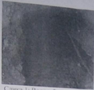
Слика 1: Водосабирник