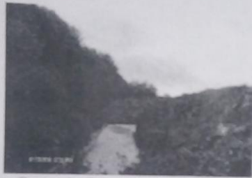
Слика 3: Формирани таложник